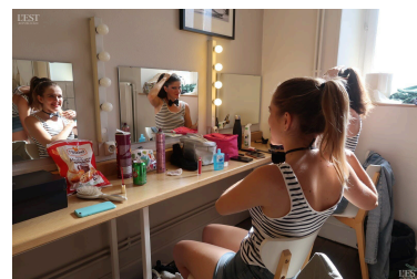
Les « grandes » se préparent dans les loges pour la répétition du mardi soir au théâtre.