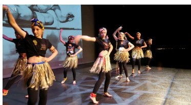
Les danseuses de la MJC répètent leur gala. Sur un air de Shakira pour ce groupe.

club de couture d'Einville-au-Jard, qui ont réalisé ces derniers mois les tutus de « Tout doucement », « L'aigle noire », ou encore les jupes du french cancan. Depuis vendredi dernier, les soirs de la semaine, les danseuses retrouvent leur professeure pour les dernières répétitions sur la scène du théâtre, avec le réglage des lumières, le placement sur scène, les enchaînements des groupes. « Je me suis trompée », assure en sortant de scène une jeune fille du groupe qui vient de danser sur un air de Shakira. Une de ses amies la rassure. Pendant ce temps, un groupe de grandes se maquille dans les loges et se coiffe comme pour les jours J. Toutes ont revêtu les costumes du gala. ■