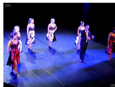
les danseuses de Françoise Martin ont animé la soirée