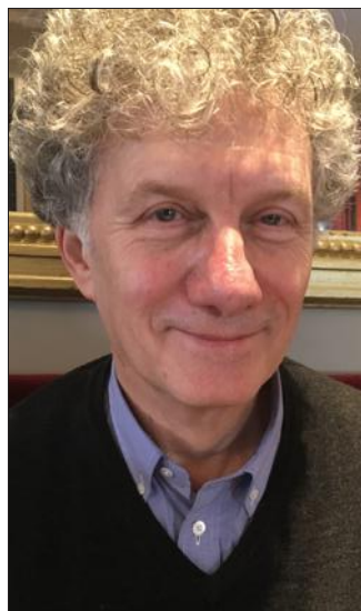
Le mathématicien et écrivain Gerald Tenenbaum évoquera son parcours.

Les maths seront sujet philosophique lors de la projection de La Philo en petits morceaux , une série de films d'animation sur la philosophie des sciences. Courts et ludiques, ces petits trésors d'inventivité réalisés par Philippe Thomine permettent de s'interroger sur les sciences, leur fonctionnement et leurs principes.