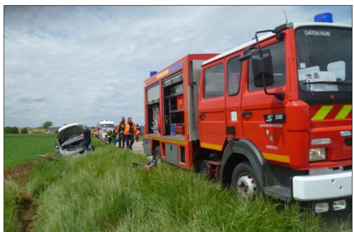
L'automobiliste seul en cause dans l'accident a pu prévenir lui-même qu'il lui fallait du secours.

Un trentenaire résidant à Maizières-lès-Vic venait tout juste de quitter le domicile parental de Val-de-Bride pour déjeuner à Château-Salins. Pour une raison qui lui échappe encore, l'automobiliste a perdu le contrôle de sa voiture alors qu'il approchait la commune d'Hampont sur la RD 28.