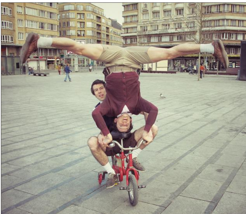
Pour être aussi barrés, il faut forcément être Belges ! Les deux artistes de la Cie Carré Curieux, Cirque Vivant ! se sont fait une spécialité de la jonglerie fraternelle et des micro-acrobaties.

Dans la salle Marie-Antoinette, à 11 h 15 et 17 h, les Troyens de Ginglyph Gateau et de la Cie Théâtre d'âme emmèneront les spectateurs dans une fabrique de papier où un employé vérifie l'authenticité du format 21 x 29,7 sur un échantillon de feuilles prélevé dans la chaîne de production. Tâche