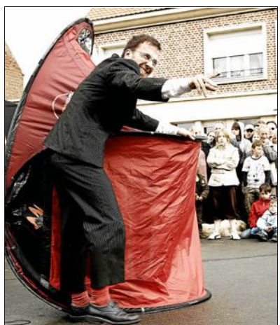
On lance la tente et elle se dépile toute seule. Pas si sûr...

Trente compagnies sont invitées à se produire sur des scènes éphémères, dans les salles polyvalentes, crèches, écoles, bibliothèques, places et rues.