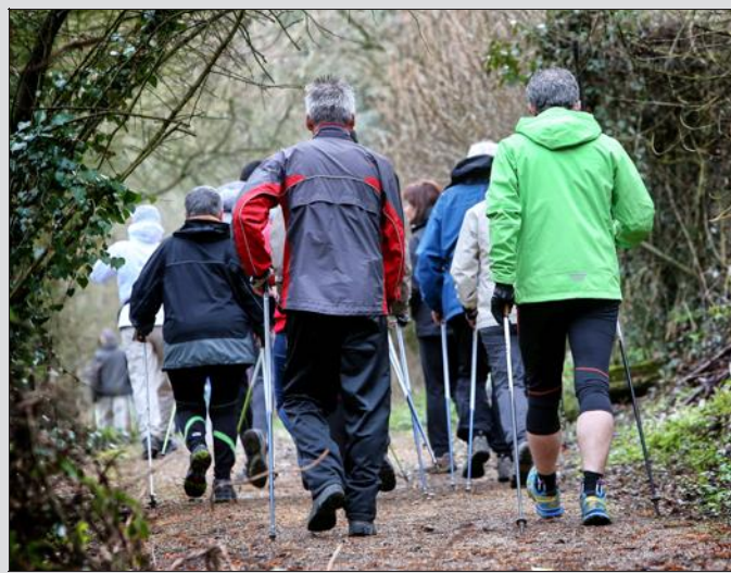
Une sortie organisée dans le cadre de la 3e fête de l'Écotourisme dans les stations vertes.