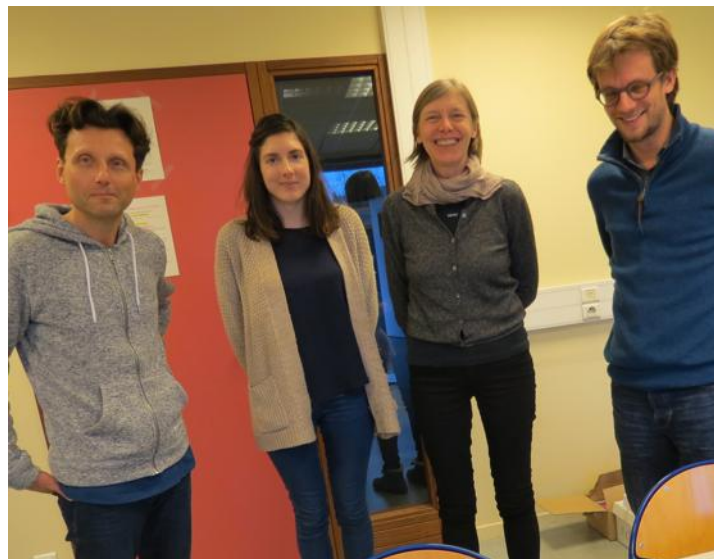
Du mercredi 25 au samedi 28 janvier, grâce à un partenariat entre l'IUT, la Méridienne, le CNAM, le collectif Kinorev, ce festival va investir les locaux de l'IUT et le centre Erckmann.