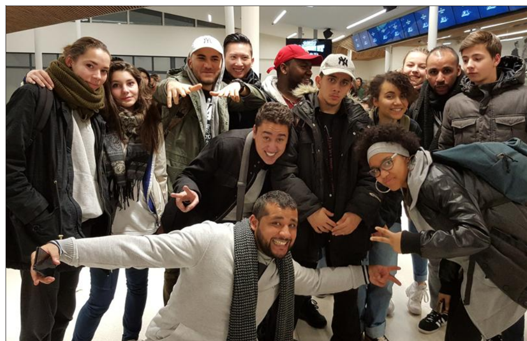
■ A Paris, une quinzaine de jeunes ont participé à l'un des plus grands événements de danse au monde : le « Juste Debout ».

Parallèlement, durant la même période, un groupe de six jeunes a assisté, à Épinal, à la SENYU 4, convention et