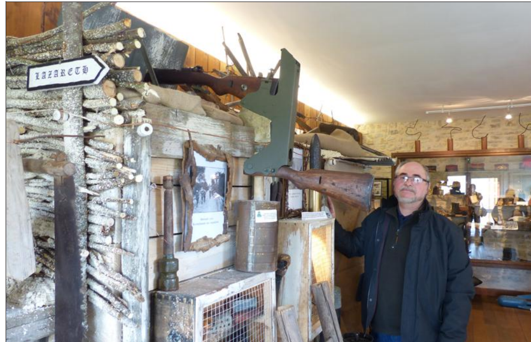
■ La bataille de la Somme vu côté Allemand. Des pièces rares comme ce poste de tir décalé avec un périscopie, sont visibles dans la tranchée.

« Le ravin du tortillard » (petit train) est le nom de cette nouvelle exposition temporaire, installée à l'espace Chaubert de la nécropole nationale Friscati-Mouton Noir. Elle sera visible au public à partir du 2 avril. Ce ravin est un lieu où se sont déroulés d'après combats (où a participé un bataillon du 69 e RI) avec prises et reprises des tranchées. Celle