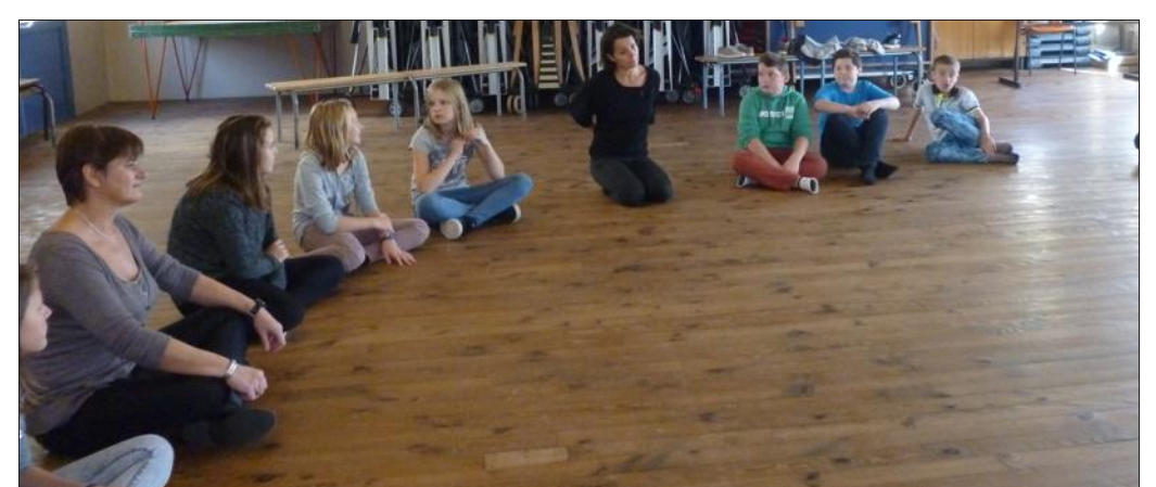
■ Une classe de 5 e bénéficie du projet de « résidence artistique » coordonné par la Méridienne.