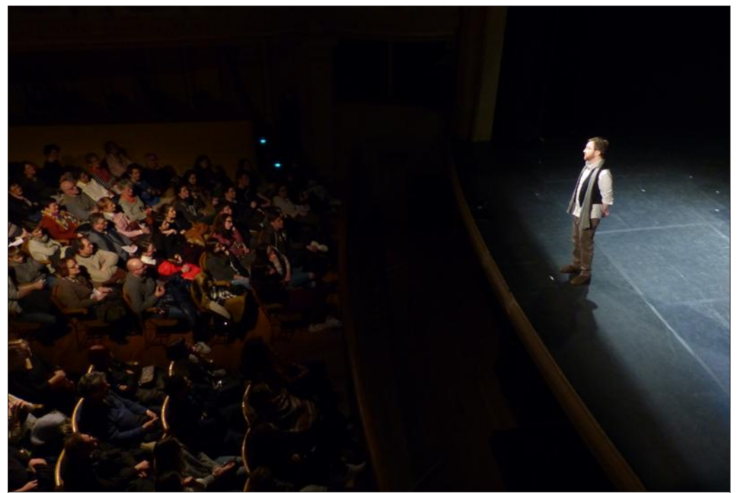
■ Le comédien jouant avec le public à action ou vérité.