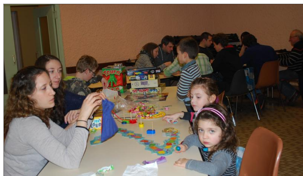
■ Parents et enfants se sont pris au jeu.

chain. Pour s'inscrire, contacter Claudine Meilender, avant le 28 février (Tél : 03.83.71.71.51).