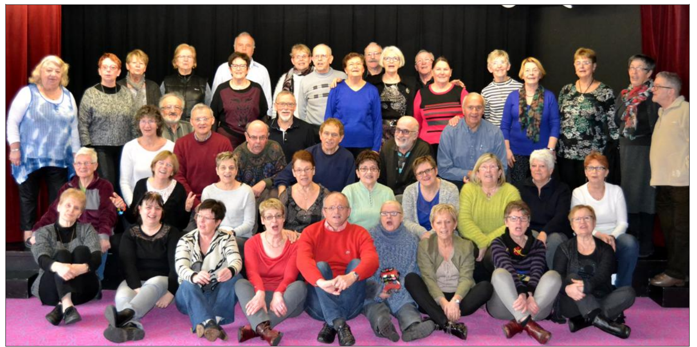
■ Du bon air, du travail et de la détente : un excellent week-end dans les Vosges pour les Croissants d'or.

Il fallait bien ce temps de détente en commun pour trouver l'harmonie nécessaire en vue de ces prestations.