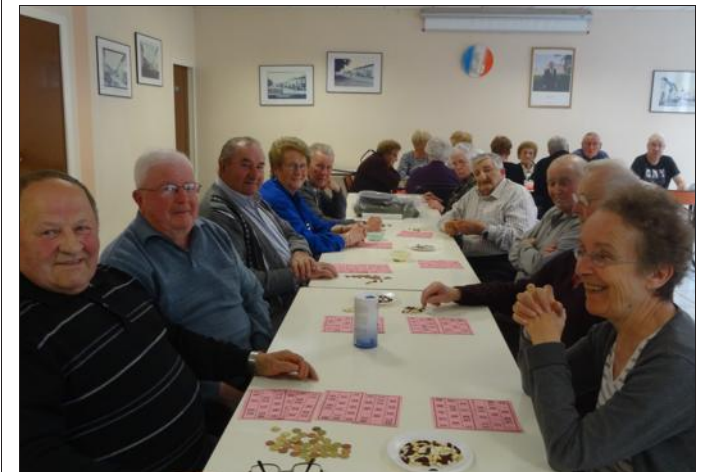
■ Un après-midi de jeux.

Les aînés des Murmures du Sânon se sont retrouvés en salle du Jard, en cet après-midi pluvieux.