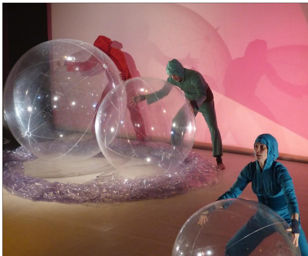
■ Les trois danseurs colorés ont évolué avec ou sans les boules transparentes.

La lumière apparaît sur scène dévoilant un troisième personnage, installé au milieu de plusieurs bulles de toute taille. Tout bleu, il exécute des bonds et rebonds devant les deux autres personnages. Là aussi, des rires se font entendre dans la salle. Après des rencontres plus