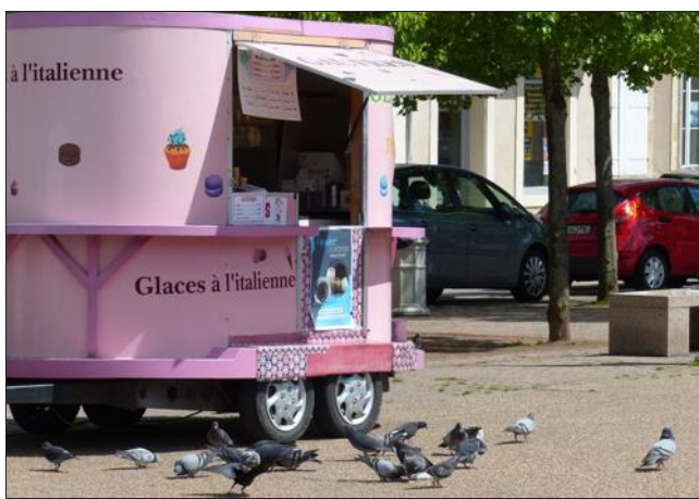
■ Les volatiles ont encerclé la cabane à glaces.