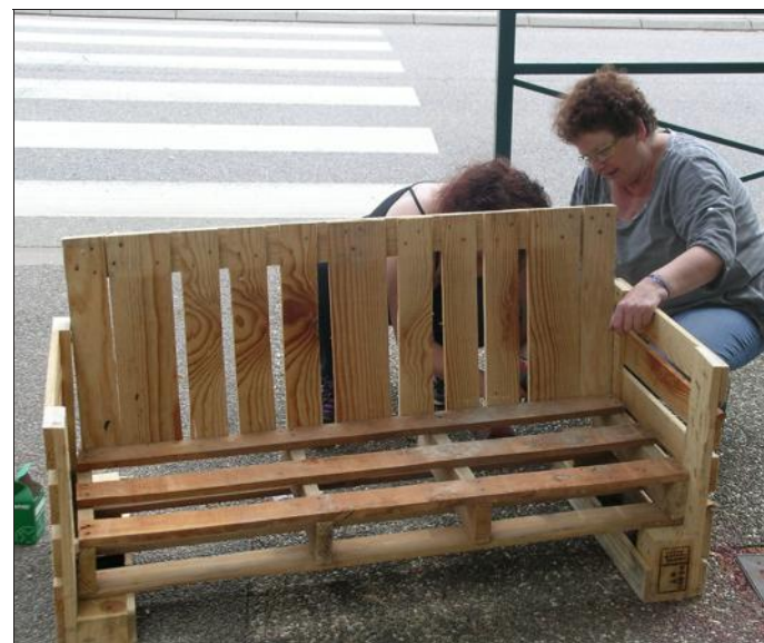
■ Ces dames se sont particulièrement appliquées. Le résultat, avec peu de chose, est très soigné. Là, elles fabriquent des accoudoirs pour plus de confort.

Ces meubles qui seront fabriqués seront installés dans les différents jardins : sièges, bancs, jardinières, luminaires - des objets ou meubles qui garniront ces jardins.