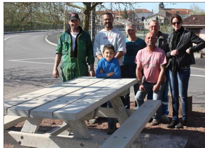
■ Des équipements qui vont être appréciés des habitants et des cyclistes de passage.

L'autorisation des voies navigables de France (VNF) pour certaines implantations (comme à proximité du canal de la Marne au Rhin) fut nécessaire, et tout ceci fut réalisé durant la semaine de l'inauguration de la voie verte, dont le village-départ était Maixe.