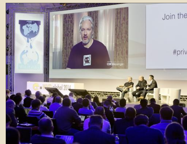
Pour des raisons de sécurité, le cyber activiste Edward Snowden participera à l'événement, mais en visioconférence.