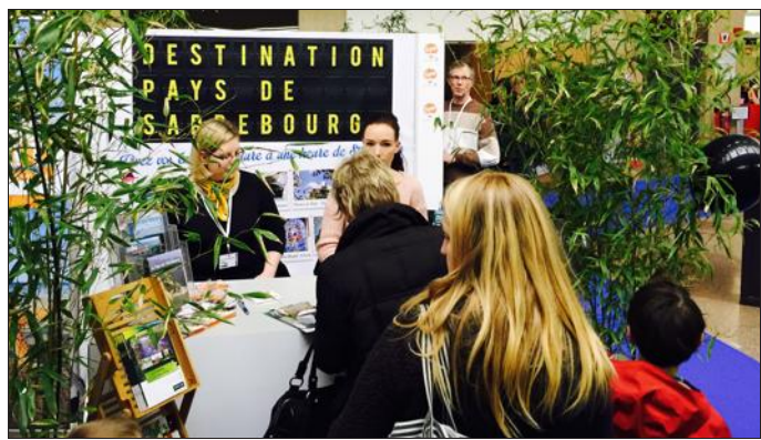
Plus de 12 000 visiteurs sont passés dimanche par l'aéroport de Strasbourg, beaucoup ont découvert les richesses touristiques du pays de Sarrebourg.

Dimanche, les offices de tourisme du pays de Sarrebourg ont frappé fort en participant à l'opération Evaday, autrement dit la journée portes ouvertes de l'aéroport de Strasbourg. Pour cette troisième édition, les offices de tourisme locaux ont su trouver leur place parmi les croisiéristes et tour opérateurs.